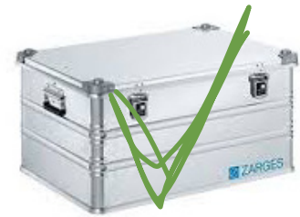
ALUBOX (Z.B. ZARGES)