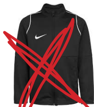
TRAININGSANZUGJACKE (ZÄHLT NICHT ALS REGENJACKE)

Bitte geben Sie Ihrem Kind auf jeden Fall eine Regenjacke oder einen Regenmantel mit. Da es durchaus vorkommen kann, dass es über Stunden oder Tage regnet, und wir uns deshalb aber nicht nur in den Zelten aufhalten wollen, ist eine Regenjacke bzw. Regenmantel durchaus nötig. Die Jacke oder der Mantel sollte unbedingt aus einem wasserabweisenden Material gemacht sein. Ungeeignet sind hier Baumwoll- oder Leinenjacken.