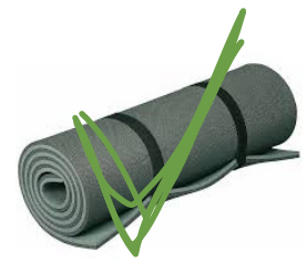
ALS AUFLAGE FÜR LIEGE BZW. FELDBETT