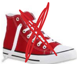
CHUCKS (UNGEEIGNET, DA AUS STOFF)

Neben Berg- Trekking- oder/und Turnschuhen zählen Gummistiefel zur Pflichtausstattung was Sie Ihrem Kind, aus oben genannten Gründen, mitgeben sollten.