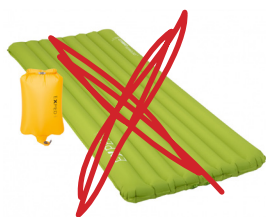
NUR ISO-/ THERMA-A-REST-MATTE

Sehr wohl kann die ISO- bzw. Therm-a-Rest-Matte als Auflage für die Liege oder das Feldbett verwendet werden um den Körper vor Kaltluft von unten zu schützen.