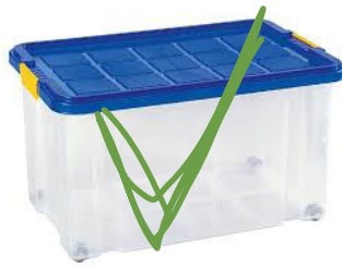
PLASTIKBOX MIT DECKEL